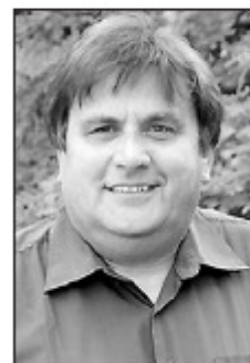
Friedrich Backs 50 Jahre Postbeamter i.R.