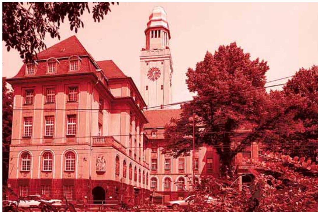
Rathaus BOCHUM: In großer Eile hat die Stadt im Revier 2003 ihr Kanalnetz verleast