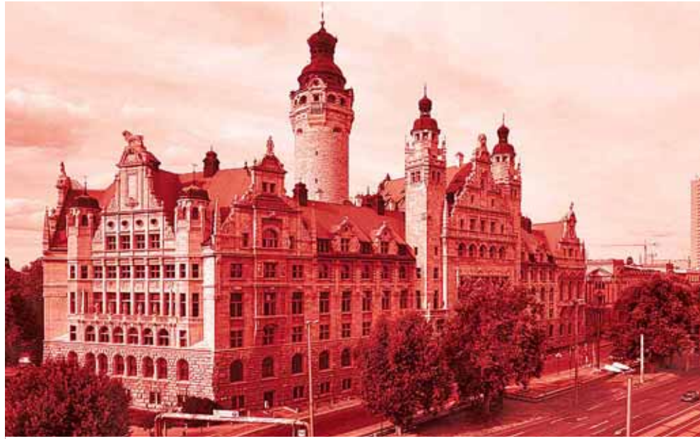
Rathaus LEIPZIG: Die Stadt hat ihre Messe, die Straßenbahnen, die Wasserversorgung und sogar das Klinikum verleast