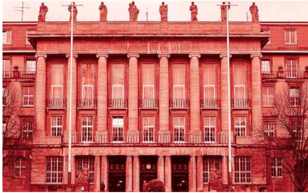
Rathaus WUPPERTAL: Die bergische Stadt hat ihre Müllverbrennungsanlage und ihr Abwassersystem verleast. An ihrem Beispiel wies ein US-Gericht nach, dass die Deals Scheingeschäfte sind