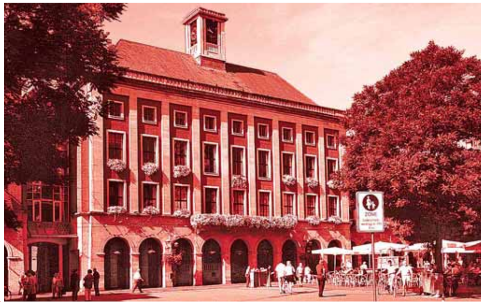
Rathaus NEUSS: Die Lokalpresse berichtet von 10 Millionen Euro Verlusten durch Swaps; die Stadt selbst schweigt dazu