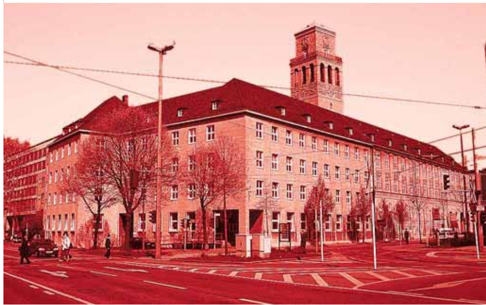
Rathaus MÜLHEIM: Die Ruhrgebietsstadt hat mit Swaps mehr als 6 Millionen Euro verloren