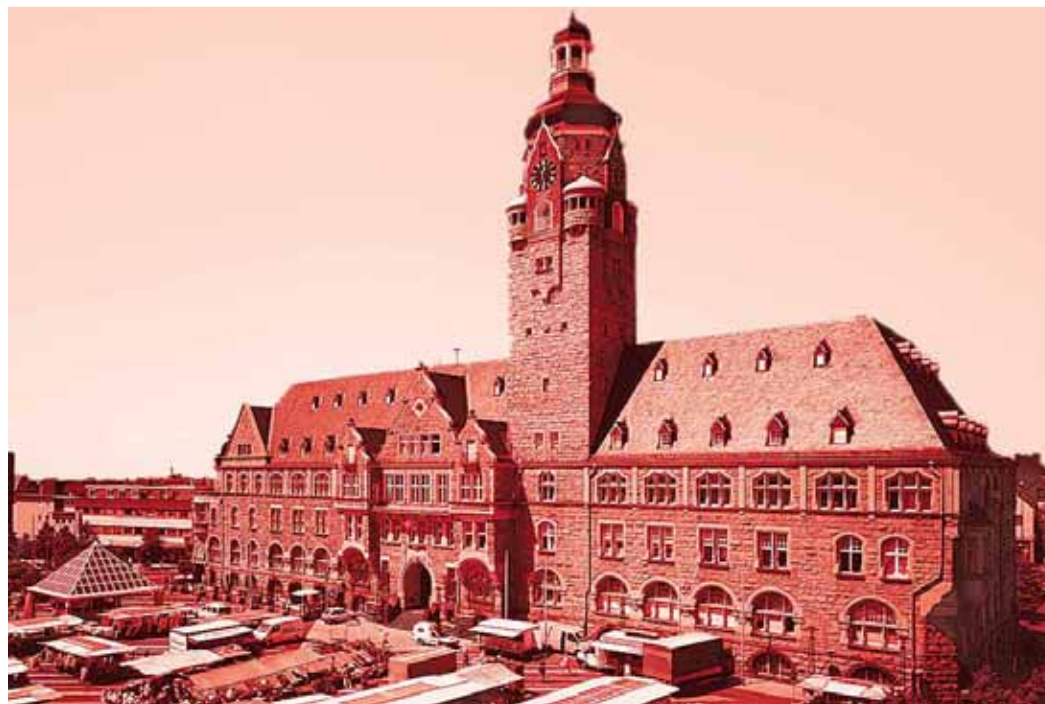
Rathaus NÜRNBERG: Die fränkische Stadt hat ihr Kanalnetz, ein Klärwerk sowie Straßen- und U-Bahnen verleast